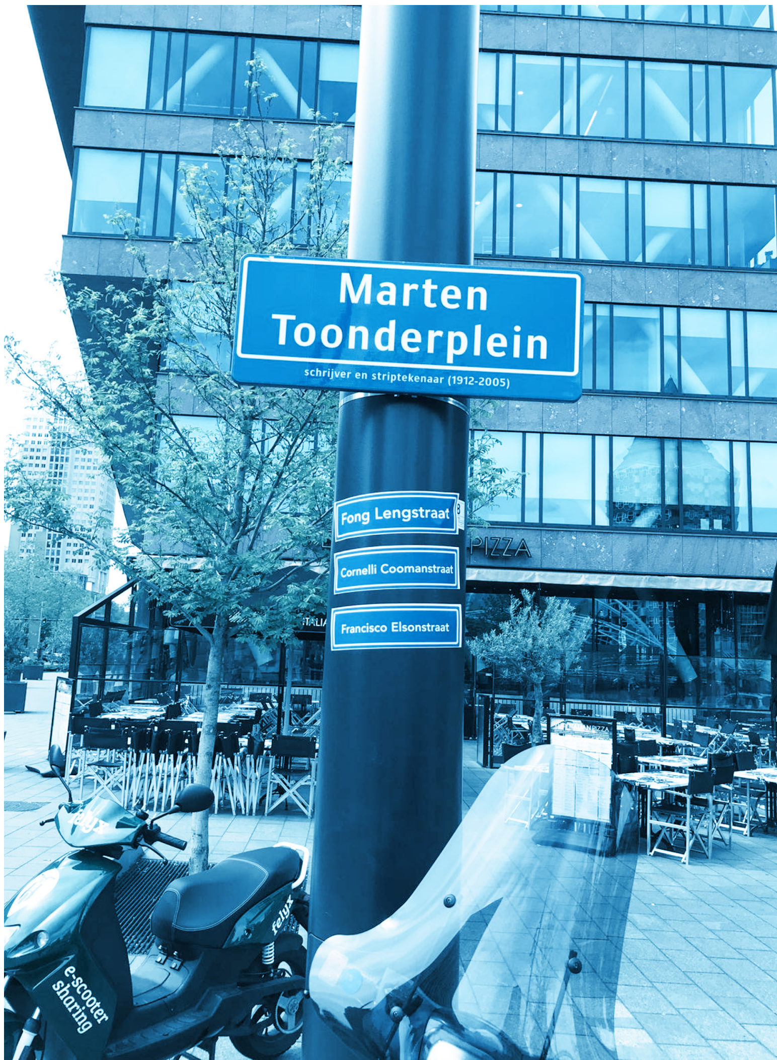
A small alteration, suggesting other possible streetnames to replace the existing one.